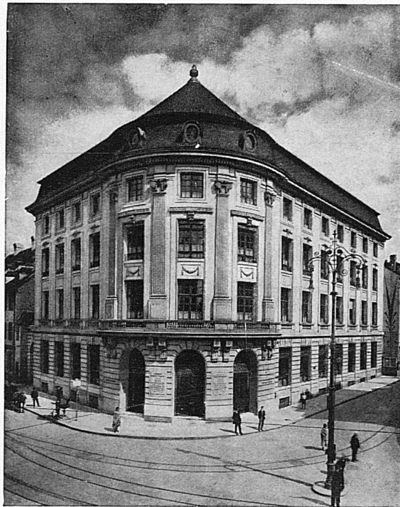
Gesellschaftssitz Basel — Siège social à Bâle