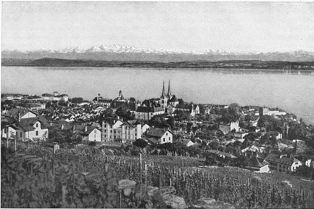
Neuchâtel / Neuenburg