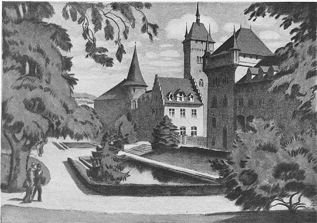
Platzspitz mit Landesmuseum / Le Musée National Suisse et le jardin du Platzspitz Nach einer farbigen Lithographie von E. E. Schlatter / D'après une lithographie en couleur de E. E. Schlatter

Nach einer farbigen Lithographie von E. E. Schlatter / D'après une lithographie en couleur de E. E. Schlatter