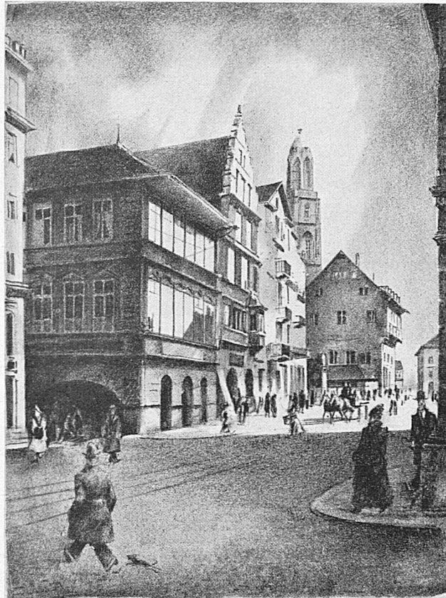
Rathausquai mit Saffran und Räden Nach einer Lithographie von O. Baumberger

In ferrovia e sui battelli a vapore si viaggia indubbiamente meglio, con maggior sicurezza e più comodamente.