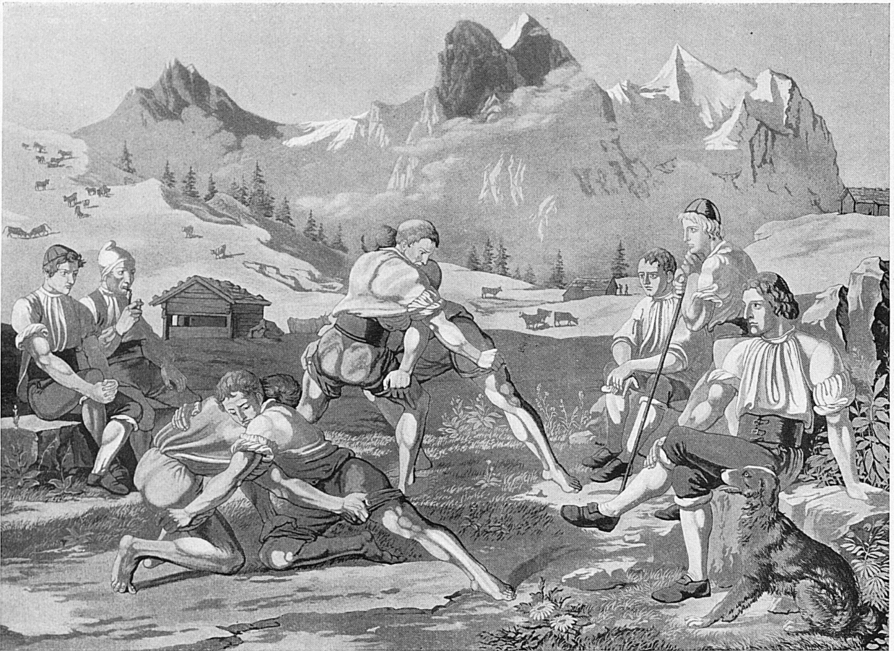
Schwingen auf der Grossen Scheidegg Zeichnung von Hieronymus Hess 1818, in Aquatinta von Lamy