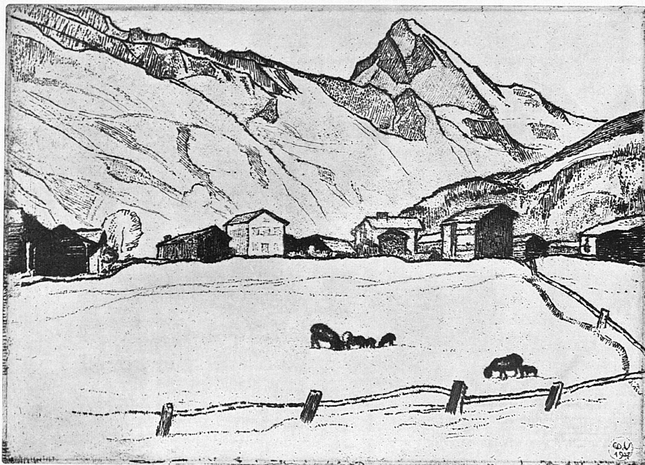
Val d'Hérens, les Haudères et la Dent Blanche

Eau forte de Ed. Vallet. Planche de la collection d'œuvres graphiques suisses «Les beautés des routes alpêtres», éditée par l'administration des postes fédérales