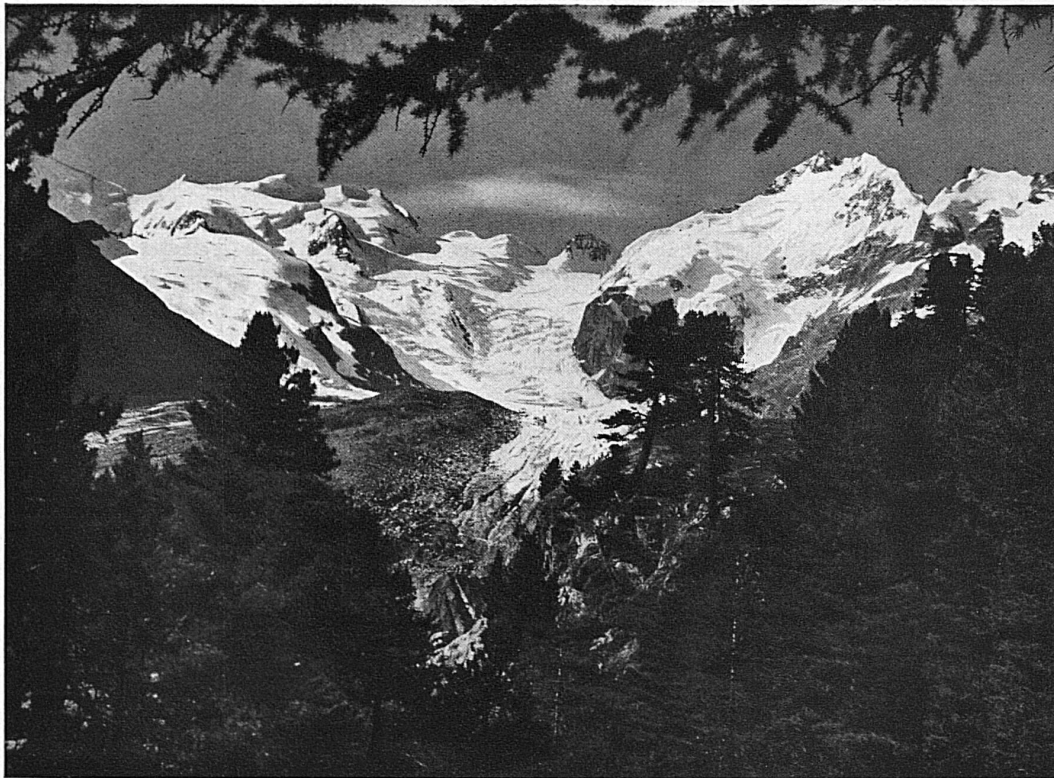
Im Gletscherzauber der Berninagrüppe bei Pontresina / Les majestueux glaciers de la Bernina près de Pontresina