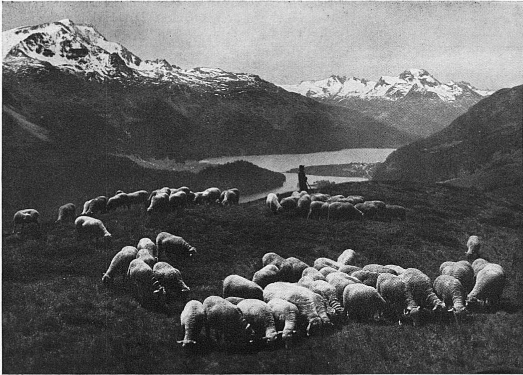
Bergidyll bei St. Moritz / La paix dans la montagne près de St. Moritz