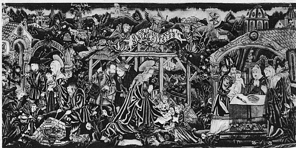
Antependium aus dem Kloster St. Anna im Bruch bei Luzern, 1598 / Antependium du couvent de Ste-Anne aux environs de Lucerne, 1598 Antependium del monastero di St. Anna a Bruch presso Lucerna, 1598