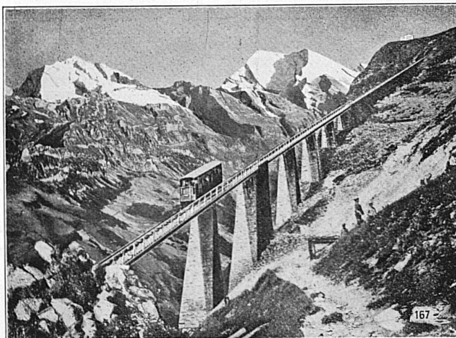
SEILBAHN NIESEN, Berner Oberland. Totale Länge 3496 m überwindene Höhe 1645 m, Maximalsteigung 68%.

Walzwerke, Schmiede, Gießereien, Elektrostahlwerk, mech. Werkstätten