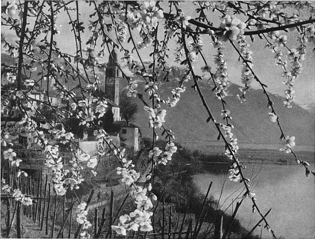
Blühender Mandelbaum bei Ronco-Locarno / Amandier en fleurs aux environs de Ronco-Locarno