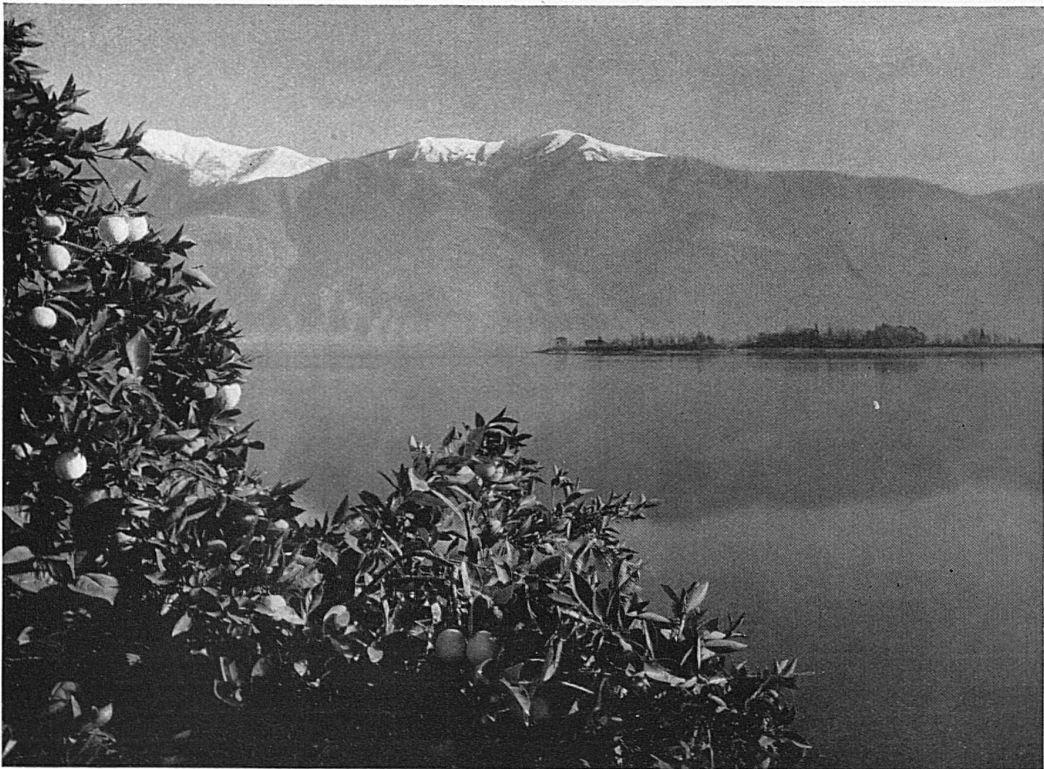
Reife Orangen bei Brissago / Orangers et leurs fruits d'or à Brissago