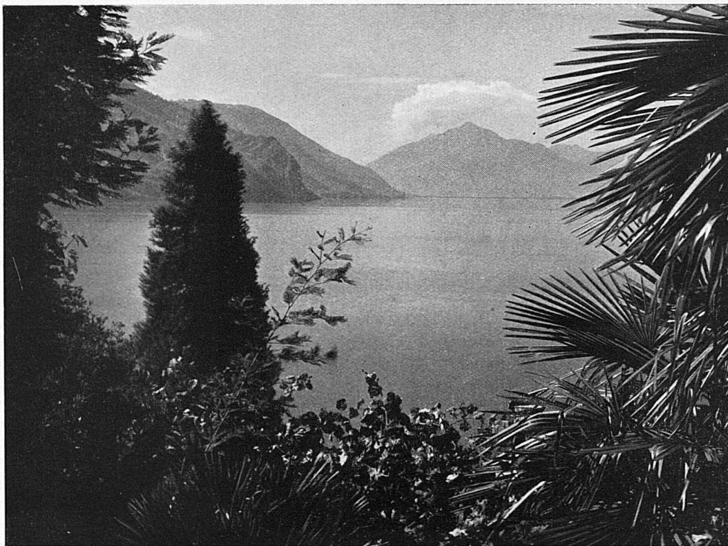
Ravissante échappée sur le lac de Lugano / Entzückender Ausblick auf den Luganersee