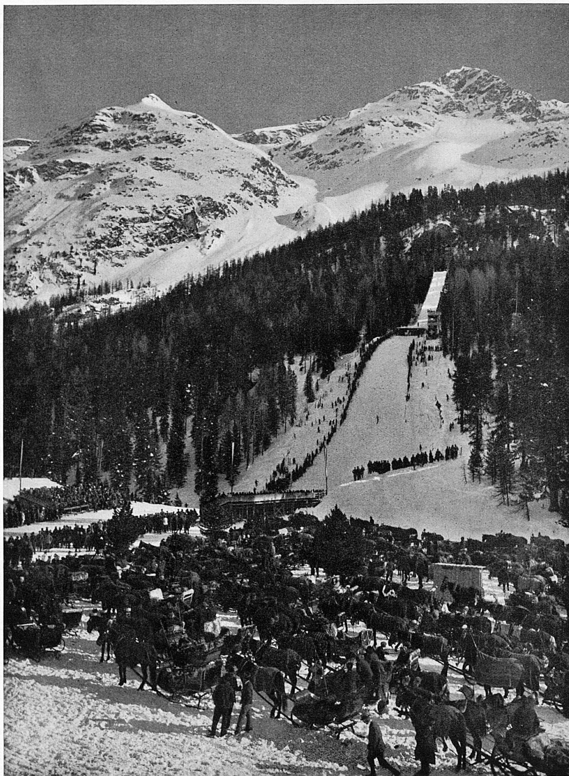
PISTE DE SAUT POUR LES CONCOURS OLYMPIQUES A ST-MORITZ