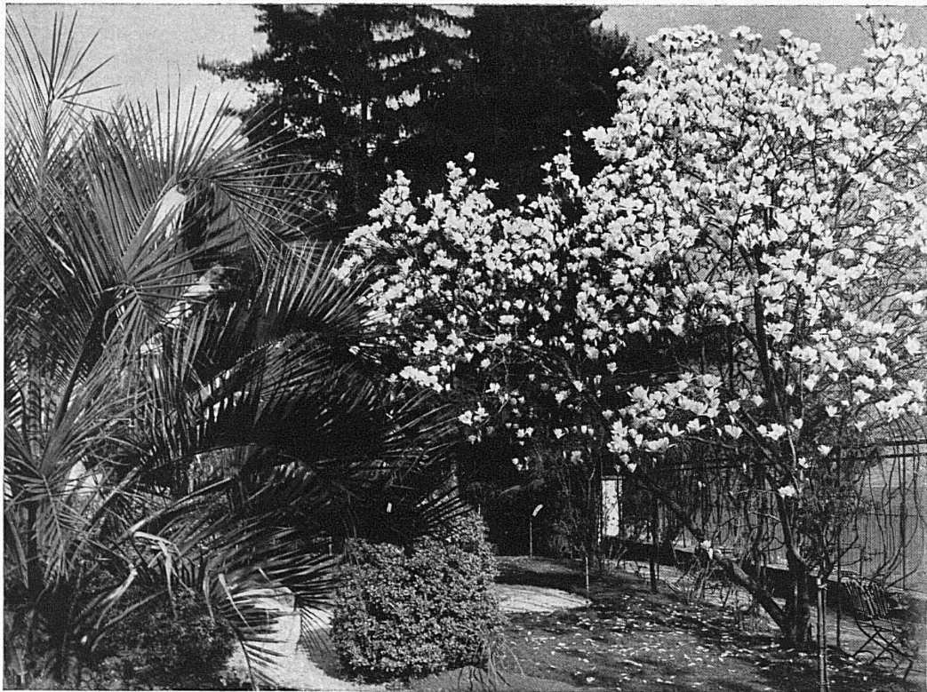
Magnolienpracht in Locarno / Magnolia dans tout son éclat à Locarno