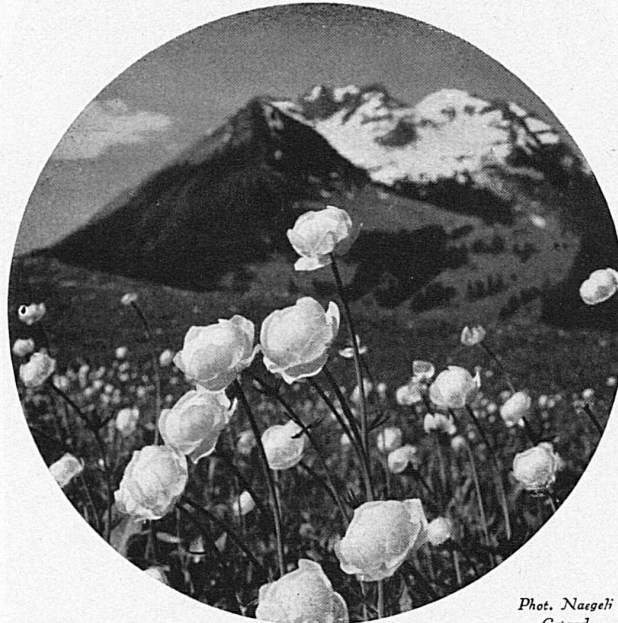
Ankebäli / Renoncules