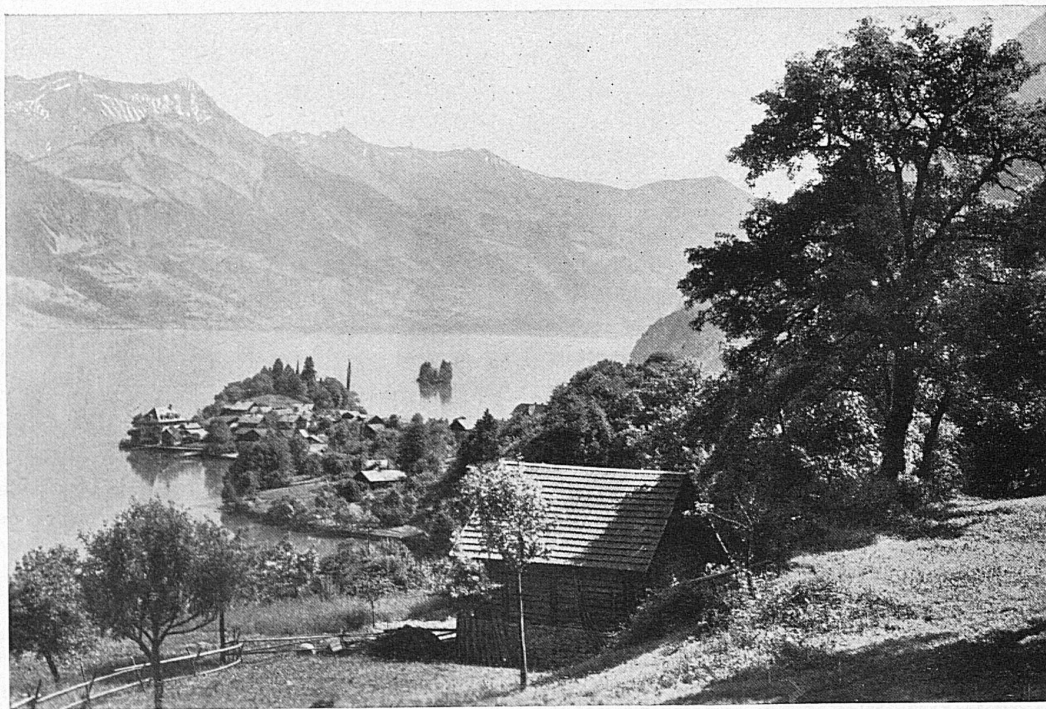
Iseltwald am Brienzensee / Iseltwald sur le lac de Brienz