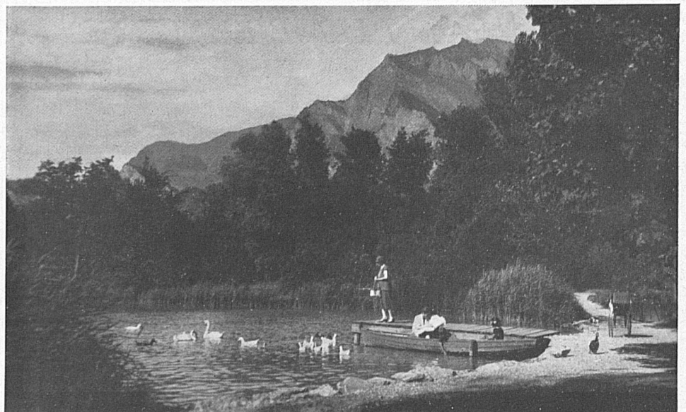
Stunden erquickender Musse in den schattigen Buchten des Giessensees bei Ragaz.

von zwei oder mehr Familien oder von Hochzeitsgesellschaften. Wegen näherer Auskunft beliebe man sich an die Billetaushabestellen der Stationen zu wenden.