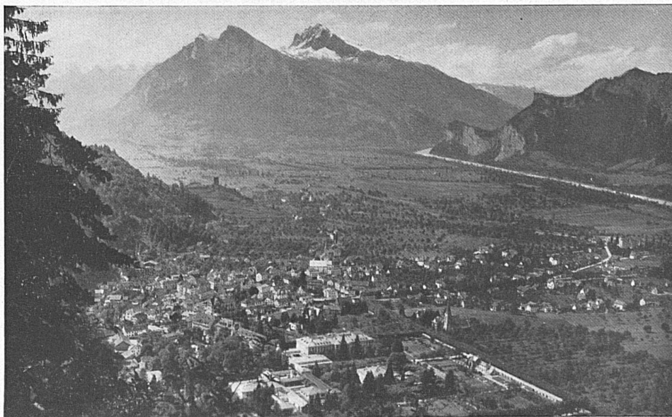
Der weltberühmte Badeort Ragaz an den rauschenden Wassern des Rheins und der Tamina.

Der Frühling ist da, leise schlägt die Nacht ihren dunk-