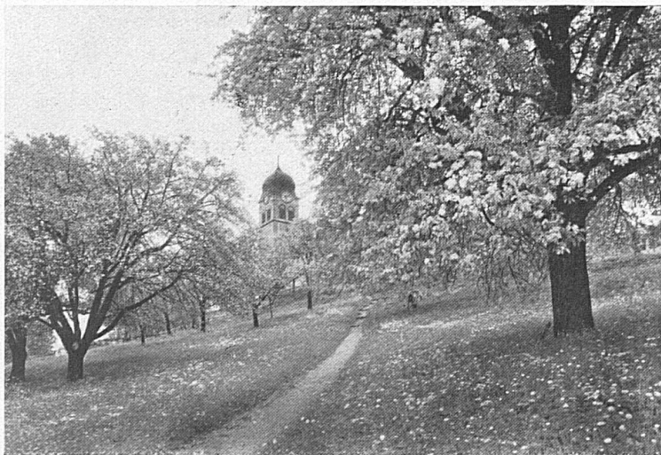
Bluestzeit am Zürichsee