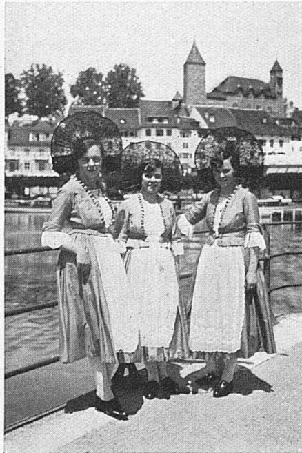
Phot. Wartenweiler Rapperswiler Rösli