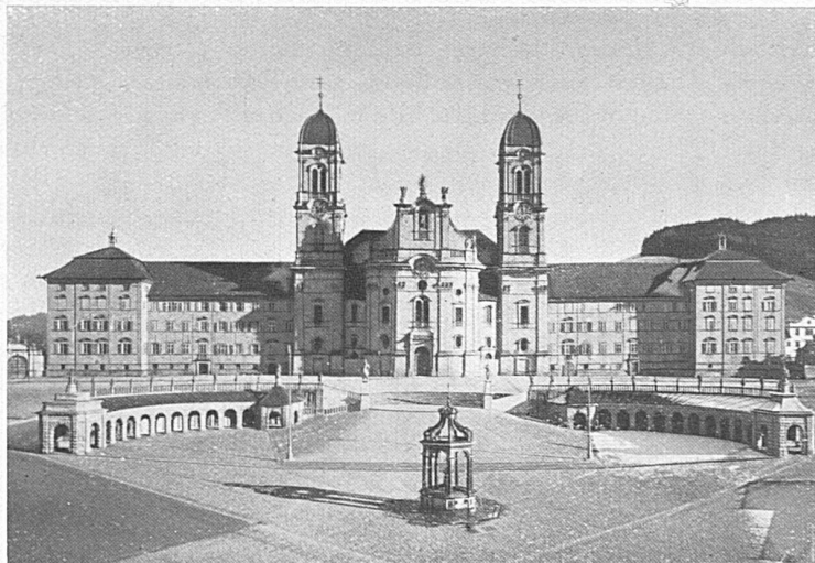
Einsiedeln, das Kloster mit Hauptplatz