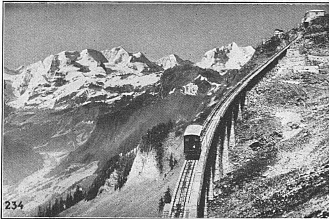
SEILBAHN NIESEN, Berner Oberland. Totale Länge 3496 m, überwundene Höhe 1645 m. Maximalsteigung 68%.

Walzwerke, Schmiede, Gießereien, Elektrostahlwerk, mech. Werkstätten