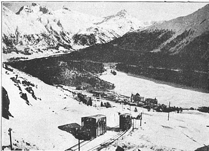
Drahtseilbahn Chantarella-Corvigliahütte 2550 m ü. Meer bei St. Moritz, Engad'n. Neueröffnung: Mitte Dezember 1928 - Blick auf die Ausweiche, auf St. Moritz-Pontresina

sibles, presque cachées, que les alentours de Locarno, en particulier le Val Maggia, offrent à qui sait s'inspirer de la nature et la comprendre. « La croix fédérale sur fond rose », « Le regret de la chaleur », « La procession du Vendredi-Saint à Mendrisio », « Le charme étrange du Val Maggia », « Explorations », « Bignasco », « Campo Vallemaggia », « Dangio », « Voies d'accès », « Le Haut-Valais », sont des croquis de toute beauté. L'éditeur a parfaitement su entrer dans l'esprit de l'auteur et nous a donné de son œuvre une maquette élégante et fort bien disposée.