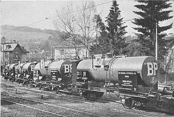
Tankwagen mit elektrisch geschweissten Kesseln zum Transport von Benzin und Petroleum

Aktiengesellschaft der Maschinenfabrik von Theodor Bell & Cie. Kriens-Luzern Gegründet 1855