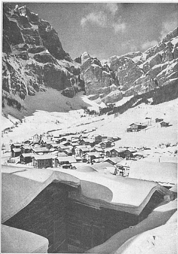
Loèche les Bains, vue sur le village et la Gemmi