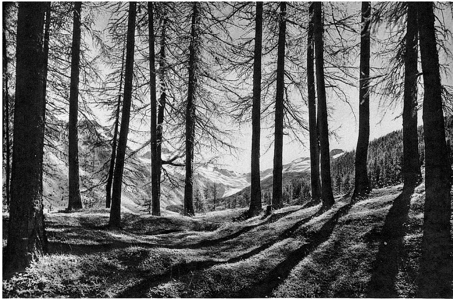
Lärchenwald im Fextal