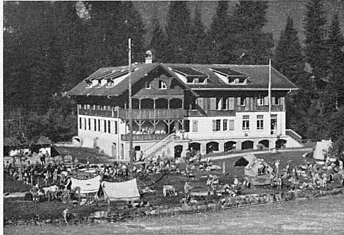
Internationales Pfadfinderheim in Kandersteg

N.G.I. "SITMAR" Navigazione Generale Italiana Società Italiana di Servizi Marittimi