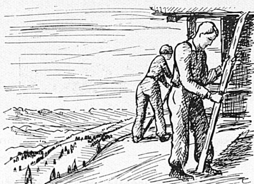
Skiwachsen zur Heimfahrt