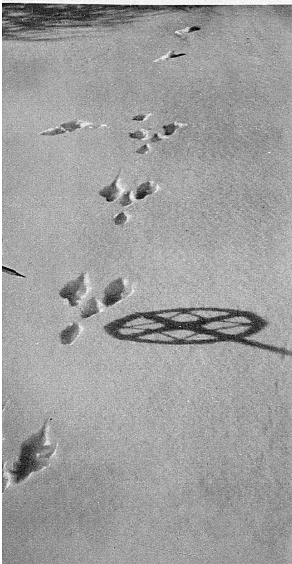
Fuchsspuren im Neuschnee

Und schliesslich, wenn man es sich überlegt: Wie sollte auch ein Städter, dem Hügel, Berg, Wald und Fluss nur Gebrauchsgegenstände für seinen Sport sind, die er in gefühlvollen Augenblickszuständen vielleicht anschwärmt, aber die er keineswegs kennt oder gar liebt — wie sollte