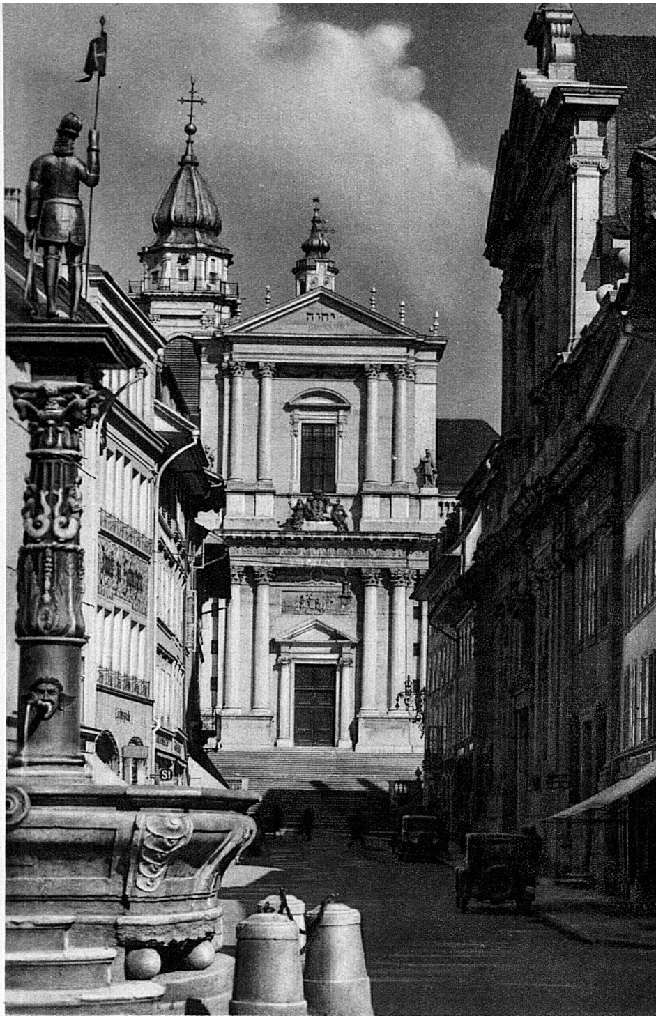
Blick vom Marktplatz mit dem Fischbrunnen durch die Hauptgasse auf Jesuitenkirche und St. Ursusmünster

Genealogie kann sich keine andere Schweizer Stadt rühmen! — und alle diese Ereignisse und Epochen haben ihre Spuren hinterlassen. Römische Grundform, gotische Strassenzüge, barocke Perspektiven — sie sind heute die Dominanten dieser einst so sehr dominierenden Stadt.