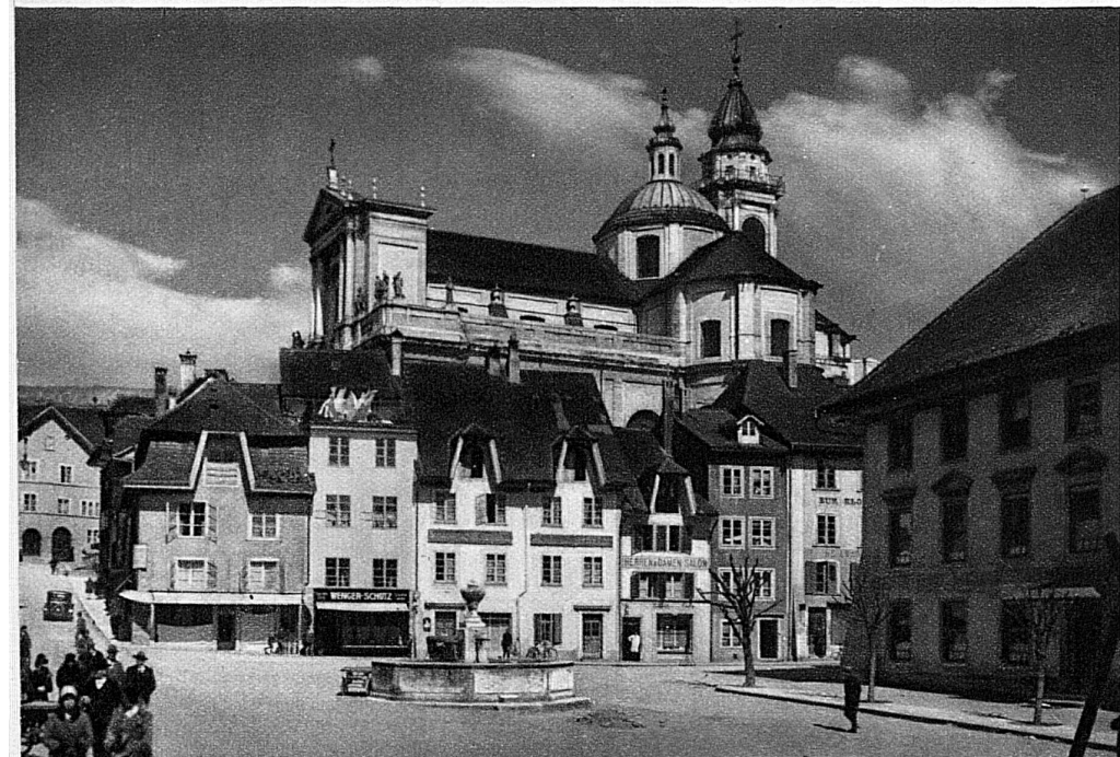
Der Klosterplatz, wo das von Karls des Grossen Mutter gestiftete Regulastift stand