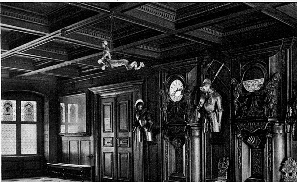
Der „steinerne Saal“ im Rathaus, wo früher die Empfänge und Tagsatzungen stattfanden