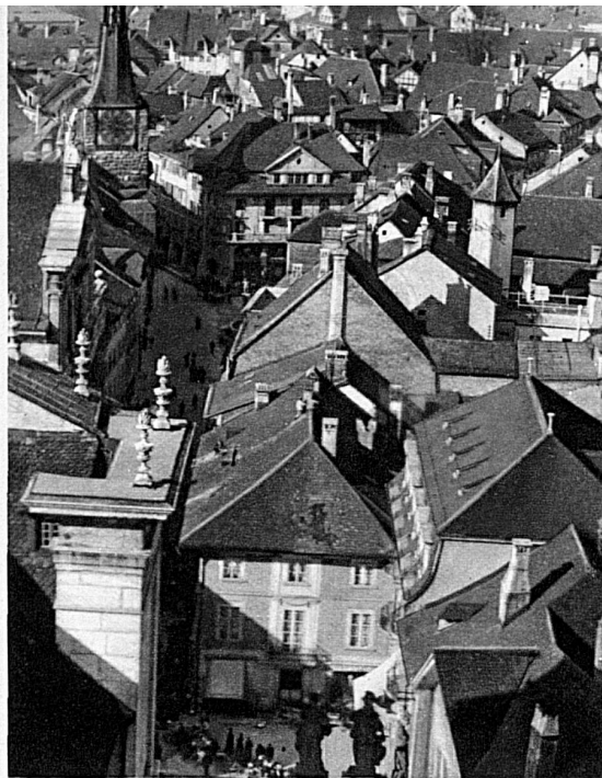
Blick vom St. Ursenturm auf den Nordteil der Altstadt