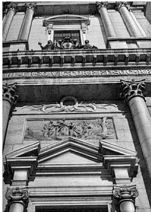
Front der St. Ursenkathedrale in Solothurner Haustein