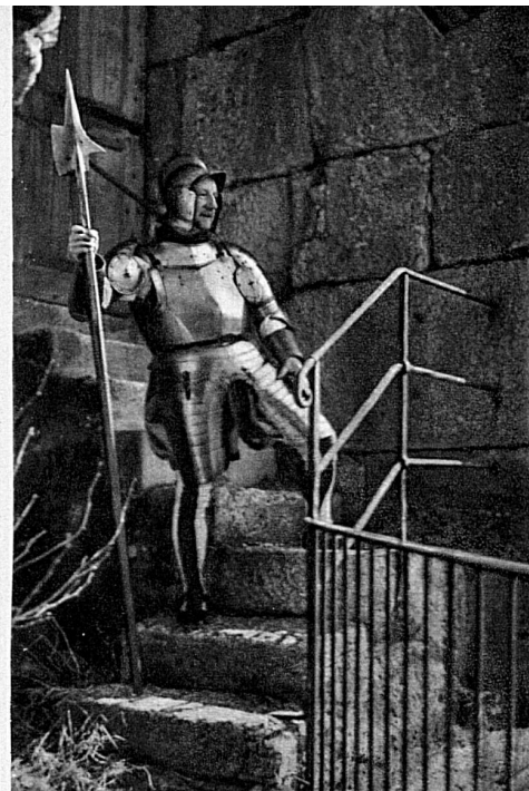
Stramme Turmwacht, Reminiszenz aus Solothurns Heldenzeit