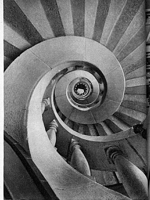
Der „Schneggen“, freitragende interessante Treppe im Rathaus

aus West und Süd zugewanderte Geschlechter, die Vigier, Gibeli, Besenval u. a. zu überragender Bedeutung auf. Wie überhaupt auf solothurnischem Boden südländische und nordländische Kultur, südliches und nordisches Blut sich kreuzten. Noch trägt das heutige Solothurn das Antlitz, das ihm die Zeit der französischen Ambassadoren gegeben. Man spürt es den behaglichen Stadthäusern, den schlossartigen Landsitzen noch an, dass sie neben der prunkhaften Hofhaltung des Ambassadors im «Hof droben» — der heutigen Kantonsschule, Schauplatz grösserer oder kleinerer «Hofhaltungen» waren. Waren doch die meisten vornehmen Solothurner Mitglieder des Rates und seiner «Ehrenausschüsse», Hauptleute in Frankreich oder Spanien, gar Obersten und Generale, und zuhause Grossgrundbesitzer im weiten Umkreis. Glaublich, dass Etikette, Höflichkeit, Mode und Luxus in der Schweiz nirgends ausgebildeter waren als in Solothurn. Es mag bezeichnend sein, dass sich der Abenteurer Casanova nicht bloss durch die Liebe zu einer schönen Frau, sondern auch durch die Annehmlichkeiten des hiesigen Lebens monatelang an Solothurn fesseln liess, aber auch um dieselbe Mitte des 18. Jahrhunderts eine ganz anders geartete Persönlichkeit