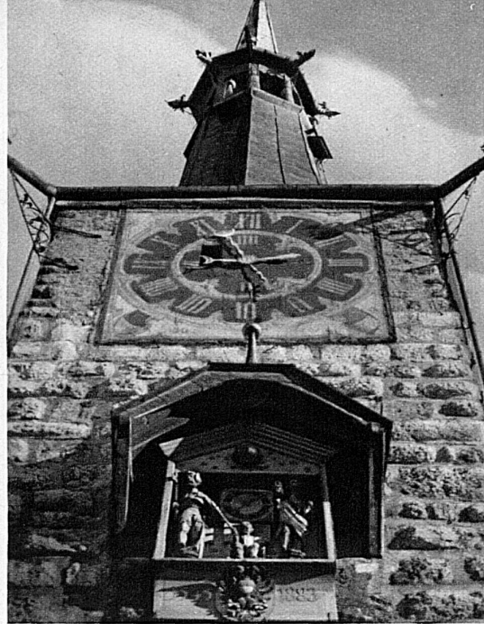
Der Zeitglockenturm mit der „Schlaguhr“ von Abrecht