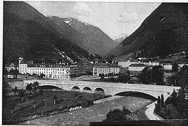
Eisenbahnbrücke der SBB über die Linth bei Schwanden

Publiée par la Direction générale des chemins de fer fédéraux. Rédaction: Secrétariat général à Berne / Annonces, Impression et Expédition: Buechler & Cie, Marienstrasse 8, Berne / Paraît une fois par mois / Abonnement: 1 année fr. 10.—, 1 N° fr. 1.— / Chèques postaux III 5688