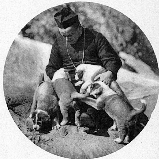
Mais les pères de l'hospice continuent à faire l'élevage de ces admirables sauveteurs pour leur valeur historique et les services qu'ils peuvent rendre ailleurs, en raison de leur bonté native, de leur puissance et surtout de leur inégalable flair