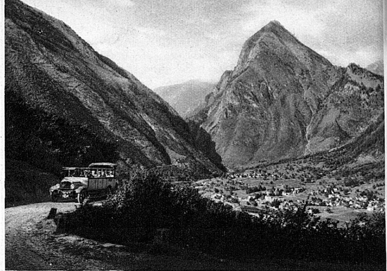
De Disentis à Acquarossa, en passant par Acquacalda et le Lukmanier, à près de 2000 m. d'altitude

reprend pas, les trésors imprévus que lui versent à flots les routes déchainées et les heures délivrées.