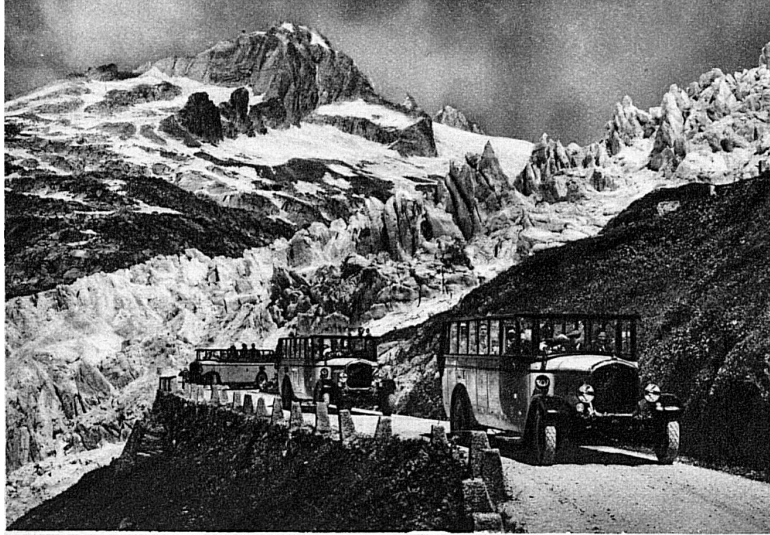
L'impressionnant cortège des autocars postaux franchissant le col de la Furka