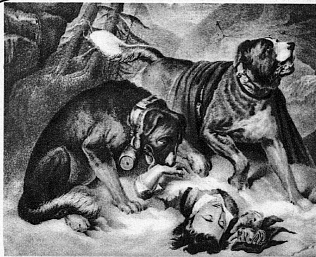
Les chiens légendaires du Grand Saint-Bernard, dont le fameux Bari, empaillé au musée de Berne, a sauvé de la mort près de cinquante personnes, sont remplacés aujourd'hui dans leur mission charitable par les avertissements téléphoniques et les patrouilles de skieurs

Ce char de feu si miraculeusement infatigable, cet oiseau de flamme vole au ras de la terre pour nous montrer les fleurs, caresse les blés, respire les ruisseaux, connaît l'ombre des arbres, entre dans les villages, voit les portes ouvertes et les tables servies, compte les moissonneurs qui se penchent sur les prés, fait le tour de l'église entourée de tilleuls, se repose à l'auberge sur le coup de midi, puis repart en chantant pour aller voir d'un bond ce qui a lieu parmi les autres hommes, à trois journées de marche du repas achevé, et surprend la même heure dans un monde nouveau. Les joies du but se multiplient, les yeux oublient enfin leur indifférente paresse, et la bonne mémoire des beautés de la terre maternelle range dans nos souvenirs, parmi les biens acquis qu'on ne nous