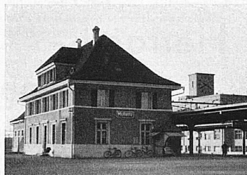
Die neuen Stationsgebäude Muttens und Ebnat-Kappel

Die Bundesbahnen haben seit der Verstaatlichung 200 Bahnhöfe und Stationen neu erstellt, ausgebaut oder erweitert, wovon 40 einen Aufwand von mehr als 1 Million Franken pro Objekt erfordert haben. Auch mit Doppelspuren, modernen Sicherungsanlagen, durch Verstärkung der Brücken und Beseitigung von Niveauübergängen haben die S B B ihr Netz unablässig ausgebaut und zu grosser Leistungsfähigkeit entwickelt.