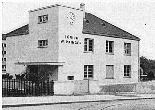
Die neuen Stationsgebäude Zürich-Wipkingen und Pfäffikon (Schwyz)

Die Bundesbahnen haben seit der Verstaatlichung 200 Bahnhöfe und Stationen neu erstellt, ausgebaut oder erweitert, wovon 40 einen Aufwand von mehr als 1 Million Franken pro Objekt erfordert haben. Auch mit Doppelspuren, modernen Sicherungsanlagen, durch Verstärkung der Brücken und Beseitigung von Niveauübergängen haben die S B B ihr Netz unablässig ausgebaut und zu grosser Leistungsfähigkeit entwickelt.