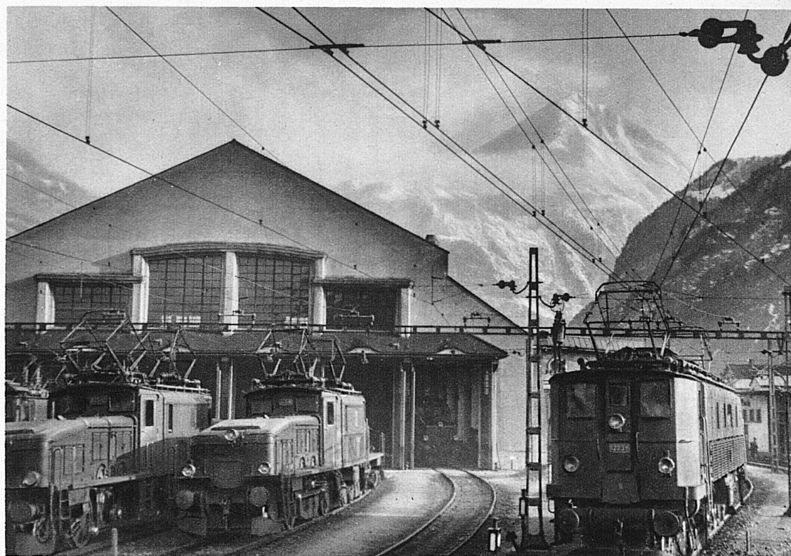
Le dépôt des locomotives d'Erstfeld et le village de Wassen

Avant d'atteindre Andermatt, on traverse de délicieux villages blottis dans les sapins au fond des vallées. La photographie représente l'église de Wassen, célèbre sur la ligne du St-Gothard.