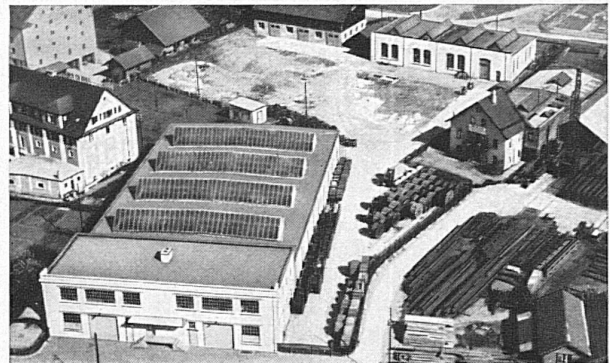
Fliegerbild unserer neuen Drahtseilerei