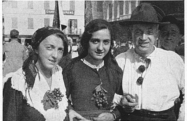
Der Winzerfest-Umzug in Lugano wird am 1. Okt. ein reizvolles Bild tessinischen Volkslebens bieten