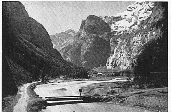
Das romantische Gasterntal ist die letzte Etappe des Militärpatrouillenlaufes der 9. Brigade vom 30. September und 1. Oktober