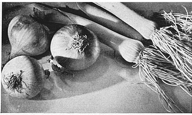
Freiburg zeigt vom 5.-16. Okt. in einer Nahrungsmittelmesse seine Erzeugnisse aus Feld und Garten und die übrigen Produkte für Küche und Keller