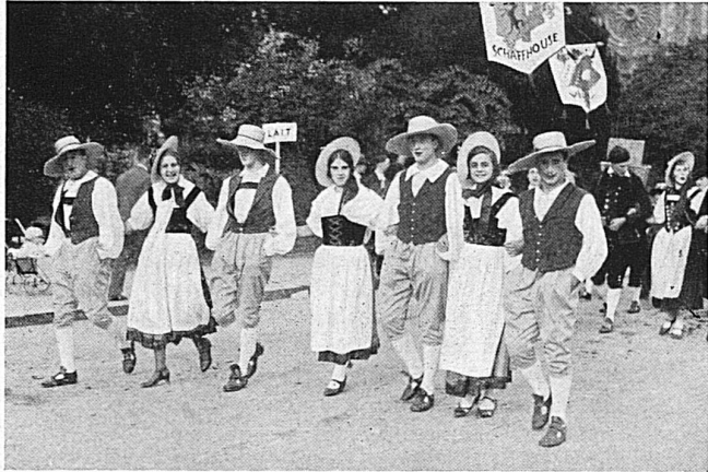
Das Winzerfest in Neuenburg am 1. Okt. ist ein grosses Herbstereignis, das niemand versäumen sollte