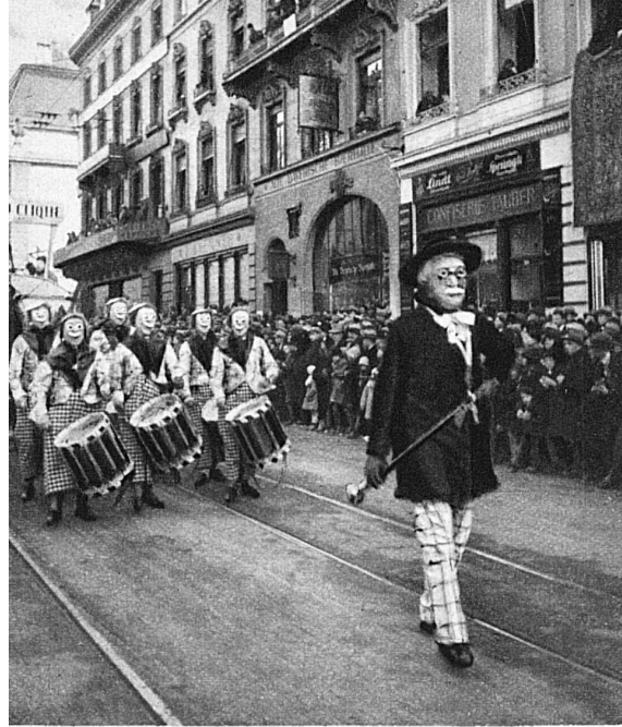
Links: Basler Fastnacht und Umzugsatire sind eine enggeschlossene, traditionelle Einheit, die in der Basler Eigenart sprechendsten Ausdruck findet