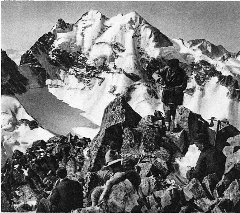
Le Piz Roseg

Au-dessous: Maloja, le lac de Sils et le Piz Rosatsch