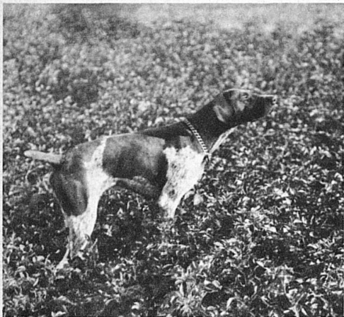
Der Hund steht vor; er hat das verborgene Wild « in der Nase » und zeigt dem Jäger die Beute an

weg, um bald wieder an verborgener Stelle, mit der Sanftheit eines herabschwebenden Flaumflöckchens, einzufallen. Dann aber mag es geschehen, dass dein Blick, selig in der köstlichen erschauernden Tiefe des Raumes sich verlierend, ungeahnt mit einem himmelhohen Segler ein Zusammentreffen erlebt, das wirklich ein Erlebnis ist. Stolzen Fluges, mit kaum wahrnehmbaren Schwingenschlägen den Körper durch den Aether treibend, als gäbe es für ihn nur noch ein Streben: Entrückung in die Höhe — prägt der Adler seine mächtigen überirdischen Zeichen in den blaufunkelnden Glask. Und unwiderstehlich die Lockung, sein gebieterischer Anruf aus der Höhe: sursum corda! Wolkensäume und Berggipfformen werden von seinen Flügelspitzen in majestätischen Kurven und Spiralen, in Volten und Sturzflügen nachgebildet. Wo anders als da