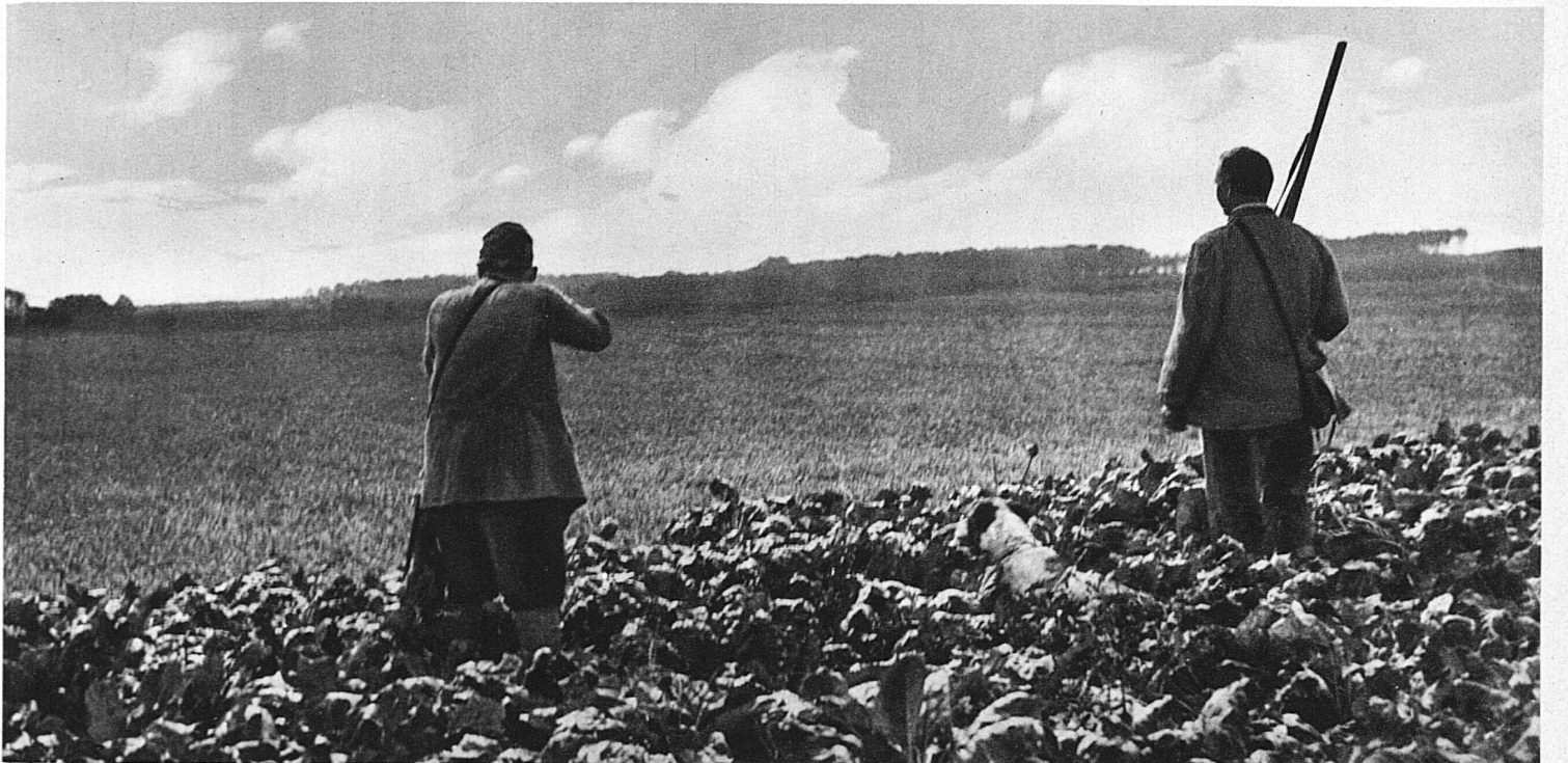
Die Rebhühner gehen hoch! Achtung, schon fällt der erste Schuss

tende Rakete erhebt er sich plötzlich bei deinem nahenden Schritt aus der Legföhren- und Erlenwirsnis und macht dir einen Gleifflug vor, wie ihn die kühnste Phantasie eines Segelfliegers kaum auszudenken vermag. Die tiefergelegenen Waldungen offenbaren dir vielleicht den urigen Ritter Urogallus, den adeligen, letzte Einsamkeiten des Bergwaldes zu seiner Wohnstätte erwählenden Auerhahn. Schreck und Erstaunen wird dich befallen, wenn der schwingengewaltige Recke sich jäh aus dem welligen Grün der Heidelbeerstauden emporwirft und mit dem Rauschen seiner Flügel alles Schweigen und Lauschen, wie von brandender Meereswoge überflutet, hinwegspült. Oben aber, wo der Waldgürtel, in letzte kleine Vorhutgruppen wetterumkämpfter Krüppelbaumgruppen gestaffelt, an das offene Gelände der Alpweiden und Bergkessel stösst, kannst du unverhofft jenes gar nicht sonderlich scheue Geflüg wahrnehmen, das im Winter ein weisses und im Sommer ein graubraunes Federkleid trägt — das Schneehuhn. Kaum vernehmbar burrend, auf leicht gebogenen Schwingen traumhaft dahingleitend, als wäre es ihm weniger um Flucht als um ein neckisches Spiel mit dir zu tun, streicht es dicht über den Boden hin-