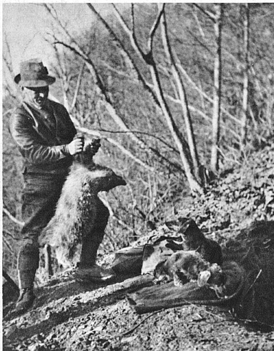
Beim Dachsgaben. Der Dachs wird von den Dackeln im Bau aufgestöbert und solange verbellt, bis der Jäger ihm nachgegraben hat und ihn dann erlegen kann