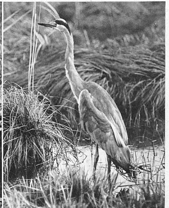
Der Fischreiher auf dem Anstand. Auch er ist ein passionierter « Jäger »