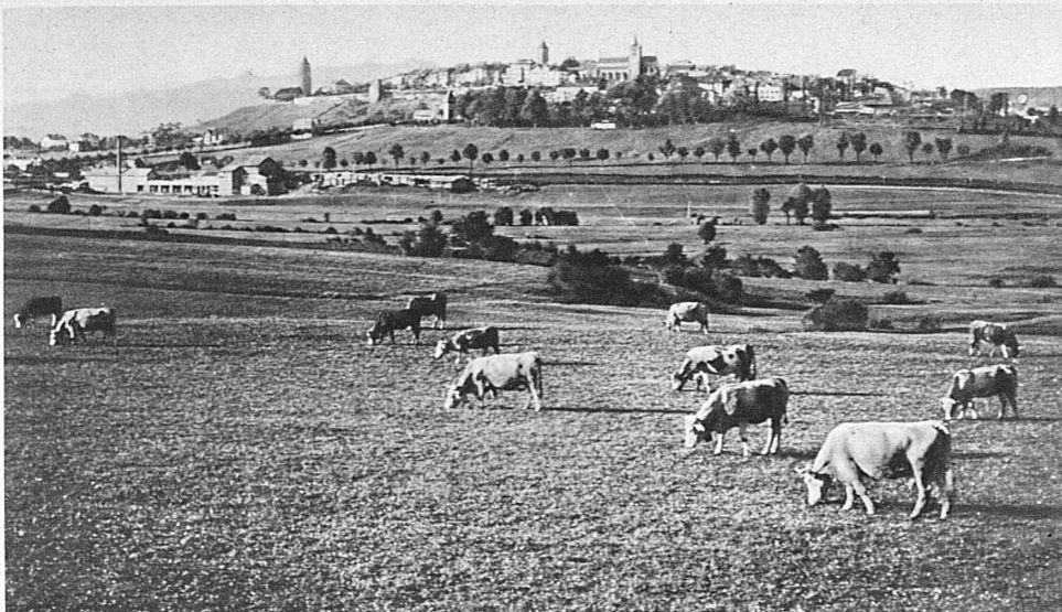
Romont, vu de l'ouest