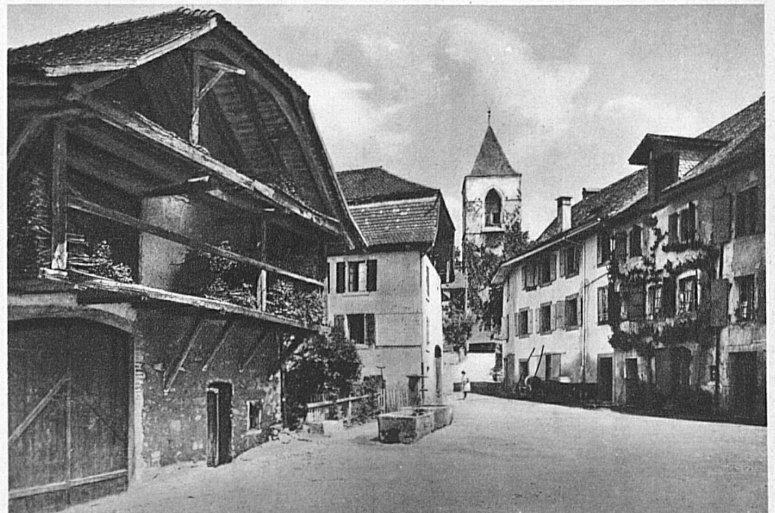
La place du village St-Légier s. Vevey

Ce n'est pas la patine du temps qui a revêtu ces esquisses: elles s'estompent, elles s'effritent, elles s'effacent; une à une, elles s'en vont, sans même que leur décrépitude s'enveloppe de ces belles couleurs chaudes qui colorent la vieillesse des objets précieux. Ici, il y a trop