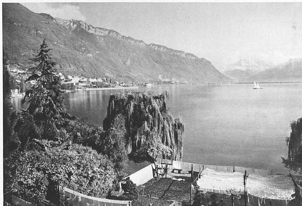
Clarens, le Léman et la Dent du Midi