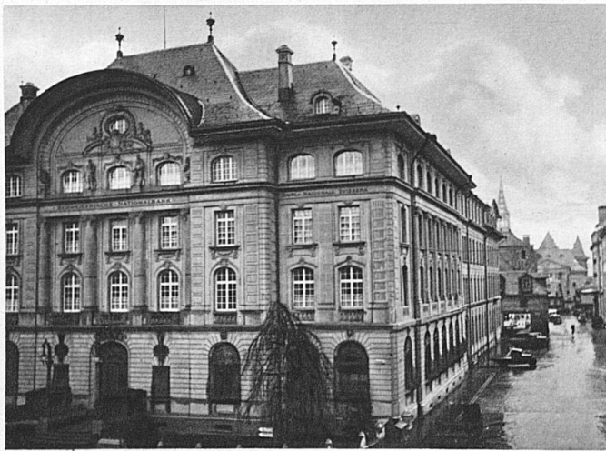
Das Amt für Verkehr befindet sich im Gebäude der Nationalbank am Bundesplatz in Bern

Da sich auch in der Bundesverwaltung selbst je nach Art des Gegenstandes verschiedene Departemente oder Dienstabteilungen mit Fragen aus dem Gebiet des Fremdenverkehrs zu befassen hatten, erachtete es der Bundesrat