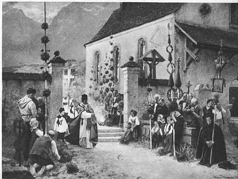
Aloys Fellmann «Palmsonntag»

Eigentum der Gottfried Keller-Stiftung, dep. im Kunstmuseum Luzern