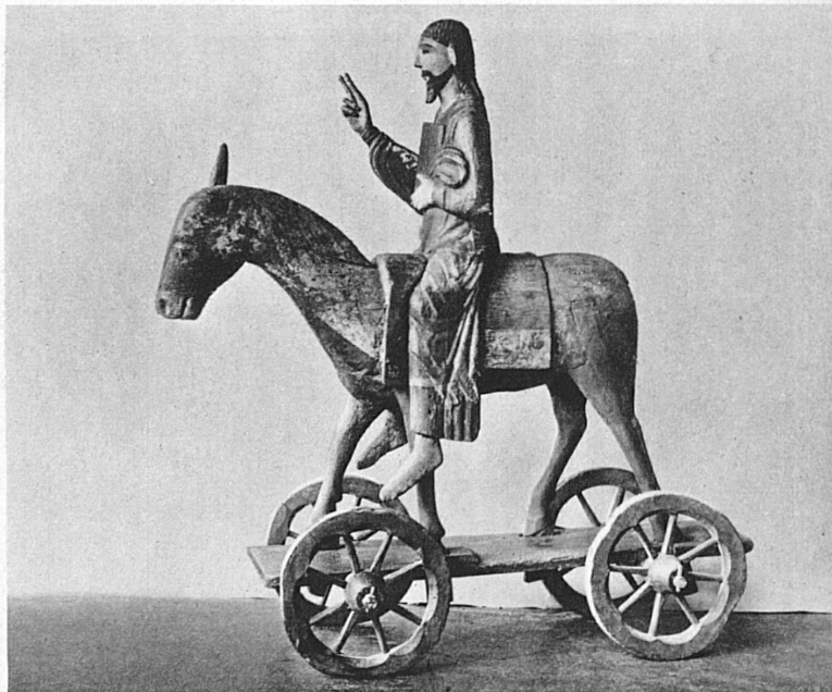
Palmesel aus Steinen (Schwyz), aufbewahrt im Schweizerischen Landesmuseum in Zürich