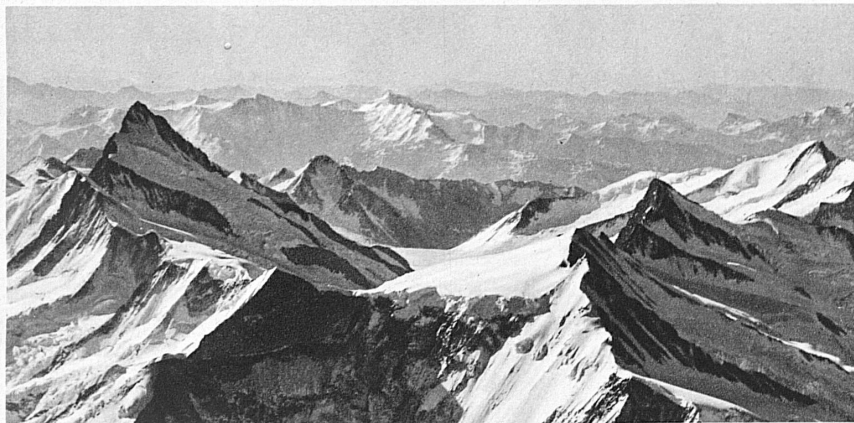
Finsteraarhorn und Grindelwaldner Fiescherhörner

land während der Winterszeit reges Leben. Wenn die kalten Monate ihren Riesentmantel um die Berge legen, dass er in die tiefen Täler niedergleitet, alle harten Formen brechend, dann öffnen die heiligen Gaststätten die sonnigen Fenster, und Tausende, die in nebligen Niederungen wohnen, streben unentwegt der Höhe zu. Im Dorf, am Talhang, überall beginnt ein frohes Treiben. Spur legt sich an Spur. Der unaufhaltsam gleitende, eilende Skilauf überflügelt sämtliche Rivalen auf dem Gebiet winterlicher Betätigung. Wo einst allein der zähe Bergbauer, der schlaue Jäger, der Holzfäller mit seinem Schlitten mühsam durch den tiefen Schnee