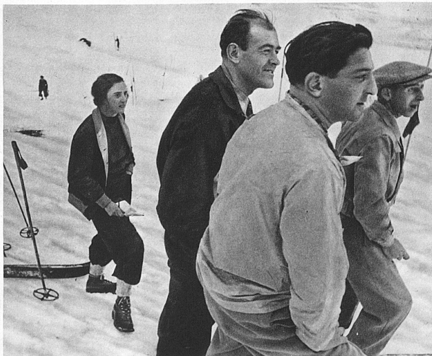
Die Argusaugen. Trainingswochen der schweizerischen Skikanonen in Mürren

land während der Winterszeit reges Leben. Wenn die kalten Monate ihren Riesentmantel um die Berge legen, dass er in die tiefen Täler niedergleitet, alle harten Formen brechend, dann öffnen die heiligen Gaststätten die sonnigen Fenster, und Tausende, die in nebligen Niederungen wohnen, streben unentwegt der Höhe zu. Im Dorf, am Talhang, überall beginnt ein frohes Treiben. Spur legt sich an Spur. Der unaufhaltsam gleitende, eilende Skilauf überflügelt sämtliche Rivalen auf dem Gebiet winterlicher Betätigung. Wo einst allein der zähe Bergbauer, der schlaue Jäger, der Holzfäller mit seinem Schlitten mühsam durch den tiefen Schnee