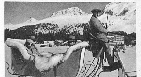
Prinz Nawab Muazzam Jah Bahadur von Hyderabad in Arosa

Der Zweck der Seva-Lotterie ist gemeinnützig. Der Reingewinn dient der Arbeitsbeschaffung aller Art, der Förderung des Fremdenverkehrs, dem Naturschutz und ähnlichen Zwecken. Die Lotterie ist vom Regierungsrat des Kantons Bern bewilligt, und ihre Durchführung ist wiederum garantiert durch die Kantonalbank von Bern.