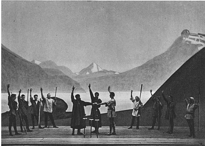
Mézières. Der Schwur auf dem Rütli