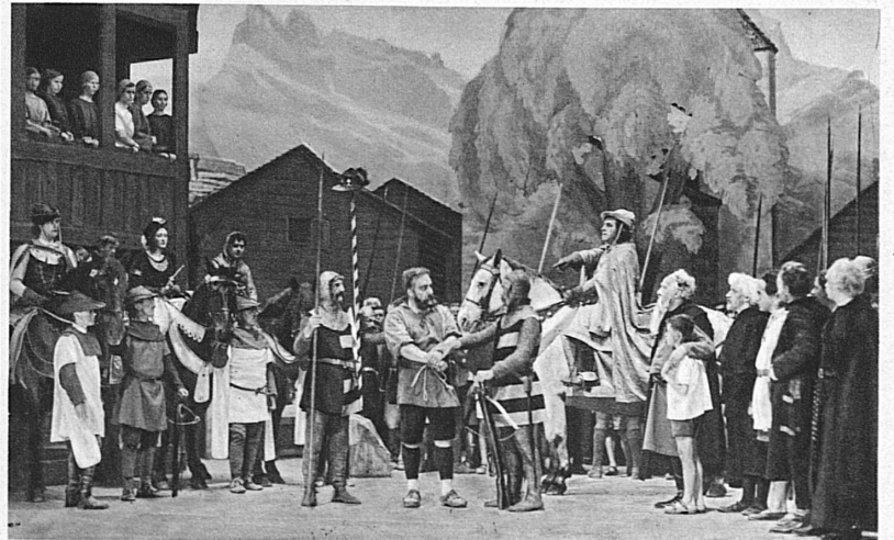
Apfelschuss. Tellspiele in Altdorf