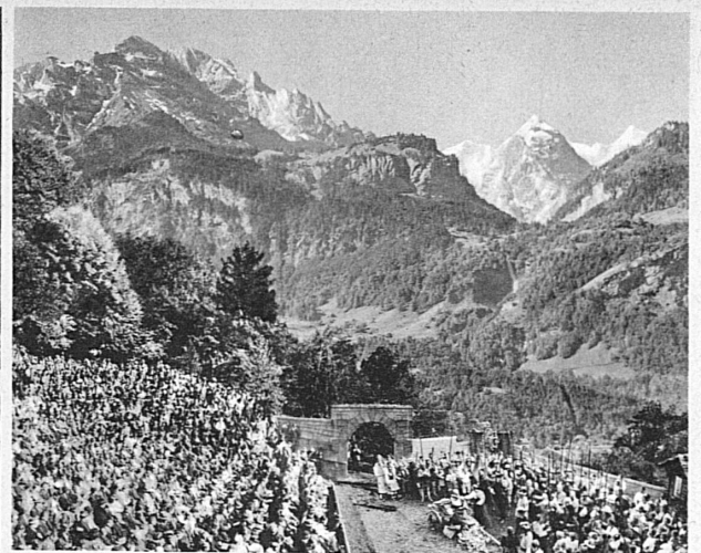
Meiringen. Die Freilichtbühne in prachtvoller Bergwelt