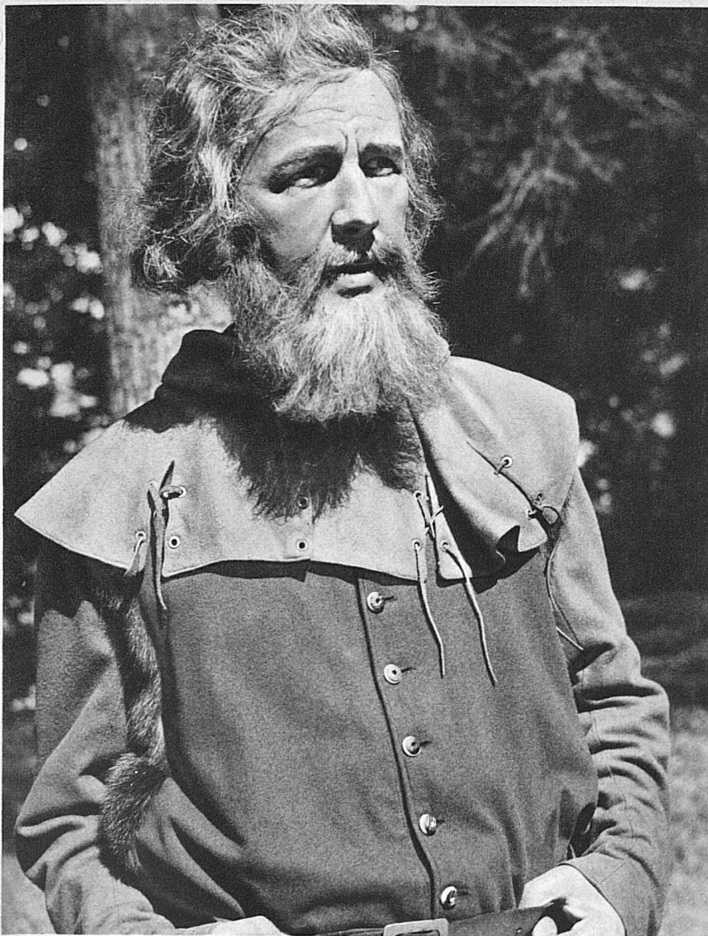
Interlaken (Berner Oberland). Wilhelm Tell-Freilichtaufführungen. Jeden Sonntag vom 7. Juli bis 8. September 1935. Stauffacher

keckem Zugriff hat Karl Weber — wie Guggenheim für St. Gallen — das Schicksal der Eidgenossenschaft in allegorischen Bildern dargestellt. Reizvoll ist die Vermischung der ernsten Szenen mit Scherz und Satire und die baslerische Umwelt, die dem Spiel ein besonders starkes landschaftliches Gepräge gibt.