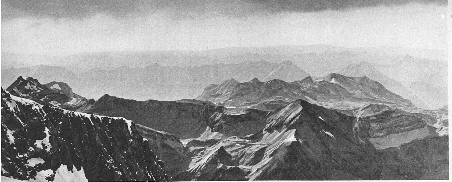
Blick vom Jungfraujoch nach Norden. Die Schweizer Skischule Jungfraujoch ist bis in den späten Sommer hinein in Betrieb; sie wird geleitet vom Schweizer Skimeister Fritz Steuri