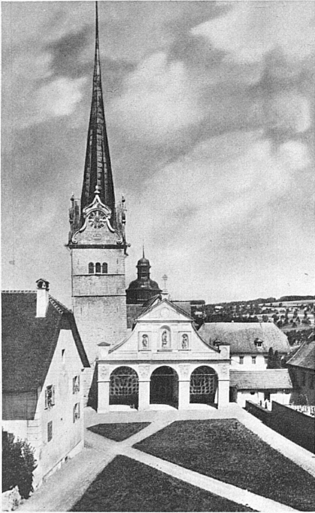
Die Stiftskirche St. Michael in Beromünster

Dieses Wort schwingt Tag für Tag von Land zu Land durch den Aetherraum, aber Beromünster, dessen Namen der Landessender führt, hat mancher seiner Hörer noch nie gesehen. Ausgebreitet in einem Talkessel des obern Wynentales, liegt der Marktflecken geruhsam und behäbig inmitten bewaldeter Höhenzüge. SBB und Postautos verbinden Beromünster mit den grössten Zentren der Umgebung.