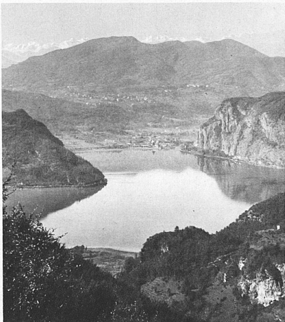
Lac de Lugano vers Lavagna

« Thun ist schön, nichts tun ist noch schöner », dit la narquoise devise de la cité de Thoune, à laquelle son château fait en effet un bonnet de fou à quatre pointes rouges où ne manquent que les grelots. « Faire est bien, ne rien faire est mieux. » Dites s'il est d'autre philosophie possible au printemps, au bord de ces lacs helvétiques où les journées sont si pleines et douces, rien qu'à en savourer l'écoulement délicieux. C'est un jour comme ceux-là que l'absurde narcissisme se laisse choir au fond de l'eau pour s'être regardé de trop près au miroir