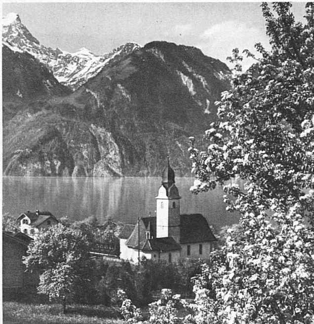
Lac d'Uri devant Sisikon

bleu: l'aménité des choses, l'innocence enfantine où la Nature est retombée, tout exclut l'idée d'un dénouement fâcheux dont pourrait se payer une fantaisie. Les champs, les bois, l'air et les eaux rapprennent les couleurs et cherchent leur palette, comme un peintre qui aurait quitté le métier et se retrouverait ébloui devant sa collection de tubes. Ces bois, dont l'hiver avait fait une peau d'ours sans tache, les voilà tout désaccordés. Les hêtres partent de leur côté sur un air de vert suraigu, les mélèzes s'enveloppent d'un nuage de chlorophylle blonde,