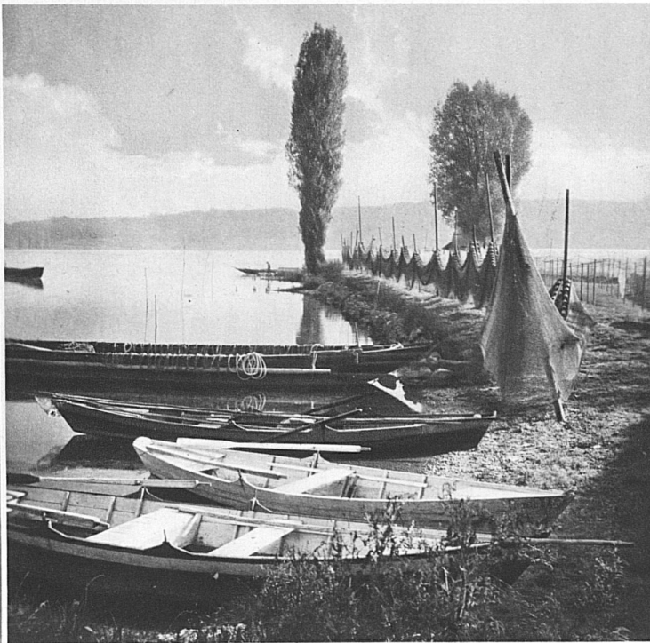
Le Bodan à Ermatingen