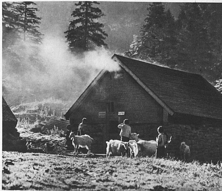
Morgen auf der Seealp (Appenzell)