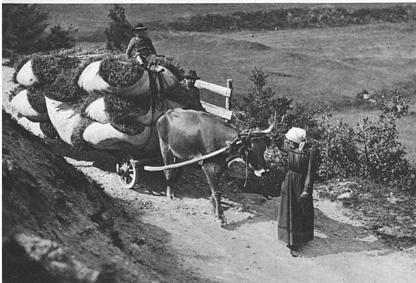
Bergheuett im Engadin