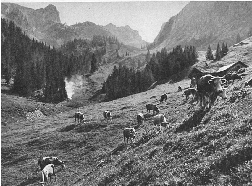
Am Fuss der Gummfluh bei Château d'Oex im Pays d'Enhaut

bruderschaft, die seit 1593 zu Bürglen besteht. Am 29. September eines jeden Jahres tagt diese Bruderschaft unter freiem Himmel auf den «Achern» zu Spiringen und wählt dabei den Sennenhauptmann, den Statthalter und zwei Fähnriche, den Obervogt, Verwalter und Kerzenvogt, der für die kirchlichen