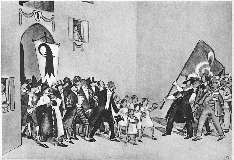
Esquisse pour une scène du Festspiel «Mutterland» qui sera représenté à l'occasion de la Fête fédérale de chant à Bâle