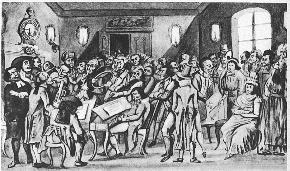
Un concert à Bâle en 1790, d'après E. Burckhardt-Sarasin