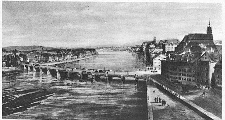
Bâle au siècle dernier

Dans sept ans, la Société des chanteurs fêtera son centième anniversaire. Cela nous reporte en 1842, à l'heure précisément où la Suisse, énervée par un siècle de capitulations devant l'étranger et de dissensions de classes, opérait un frais et enthousiaste redressement. On eût dit qu'elle retrouvait soudain les sources chaleureuses où les ancêtres avaient puisé leurs fameuses énergies. Ces frères, qui se boudaient, se reconnaissaient et scellaient un pacte nouveau. Tout leur était bon, pourvu qu'il les reliait. La cité d'Aarau, promue on ne sait pourquoi, comme une sorte de Delphes de ces amphictyonies, voyait coup sur coup se créer la fédération des tireurs, celle des gymnastes et celle des chanteurs. C'est en 1842 que, pour la première fois, les phalanges de la Jeune-Suisse chantante y acclame la bannière fédérale des chanteurs, dont les plis écarlates se gonflent d'un air de liberté nouveau. Et depuis lors, chaque fois qu'en ces fêtes ardentes elle s'en vient, balancée aux poings d'un doyen, solennellement reçue et haranguée comme la souveraine des cohortes jubilantes, c'est l'esprit de 1842 qui s'éploie sur les foules assemblées, le frisson de la patrie qui passe.