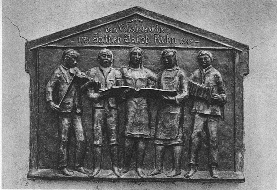
A la mémoire d'un chanfre populaire: G. J. Kuhn. Une plaquette érigée à Sigriswil