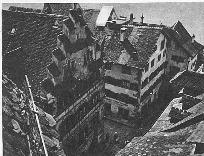
Die Kleinstadt mit ihrer Romantik hat den ganzen Zauber der Wanderburschenzeit bewahrt. Zug mit seinen alten Häusern und Gassen