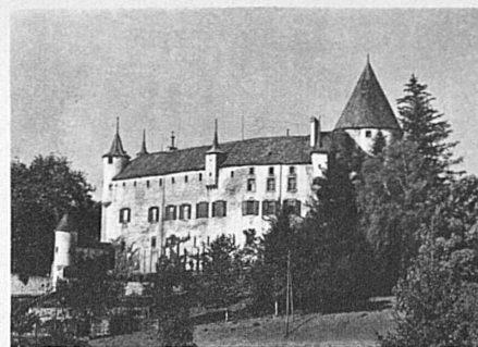
Schloss Oron in der Waadt

Installationsmaterial für elektrische Freileitungen • Krane aller Art und Verladeanlagen • Baumaschinen • Transportanlagen • Schützen für Stauwehre und Turbinenanlagen